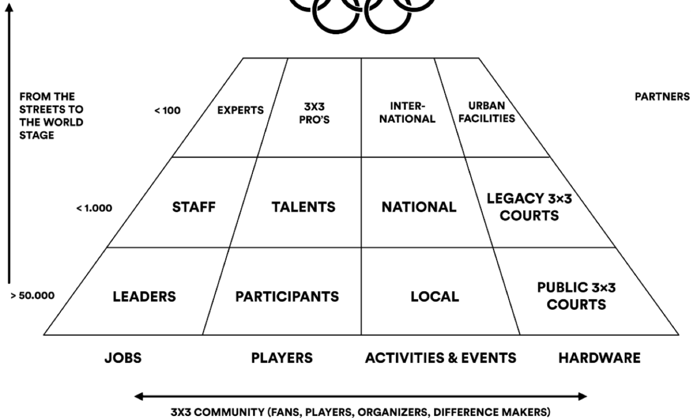
Figuur: 3X3 Unites ecosysteem